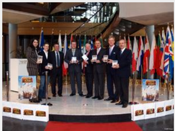
Die Übergabe von Anno 1701 an die EU-Politiker in Strassburg